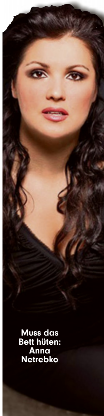
Muss das Bett hüten: Anna Netrebko

München - Der Tierpark Hellabrunn hat eine tierische Attraktion: Zwei große Kulleraugen, ein kleiner Langhals und viele kleine Flecken: Das Münchner Giraffen-Baby (Foto) ist endlich da! Noch hat es keinen Namen, dafür trinkt das 45-Kilo-Geschöpf (Größe: 1,70 m) brav bei Mama Kabonga (18) Milch. Für die Giraffen-Mutter war es bereits die achte Geburt. Am 5. April plumpste das Baby aus zwei Metern Höhe ins Stroh. Zusammen mit Mutter Kabonga gewöhnte es sich im Stall des Elefantenhauses an die Münchner Luft. In den letzten Tagen lernte es auch Papa Togo (20) und Schwester Ijuma (3) kennen.